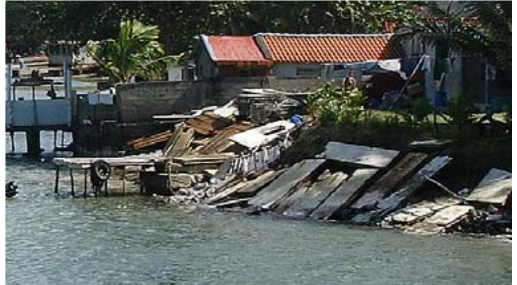
Matériaux de construction et encombrants jonchent l'espace public

Dans une île où le clivage social est encore présent, le monde végétale est fédérateur. La réflexion sur des projets de paysage permet de rassembler les insulaires sur une problématique commune.