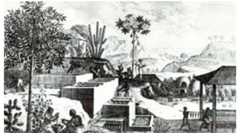
“Une indigoterie aux Antilles au XVIII e siècle, extrait de Les Antilles, Daniel Moreau, 1974, collection Monde et Voyages, Larousse