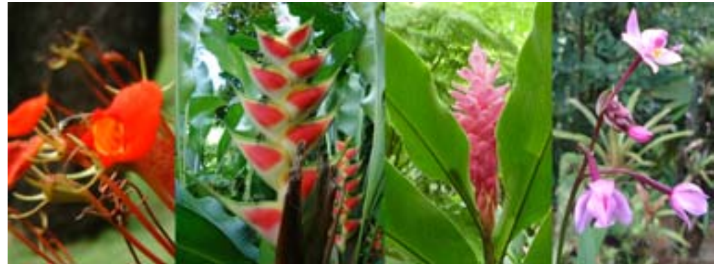
Madinina, l'île aux fleurs, une image excessivement utilisée

Les fleurs tropicales constituent pour bon nombre de touristes un élément exotique. Conscients et forts de cette attraction, les jardinières et autres massifs colorés fleurissent de toutes parts sur l'île et à tort et à travers. Ces éléments fleuris sont présents dans toutes les villes de Martinique, ils banalisent le paysage et transposent une vision métropolitaine des infrastructures urbaines.