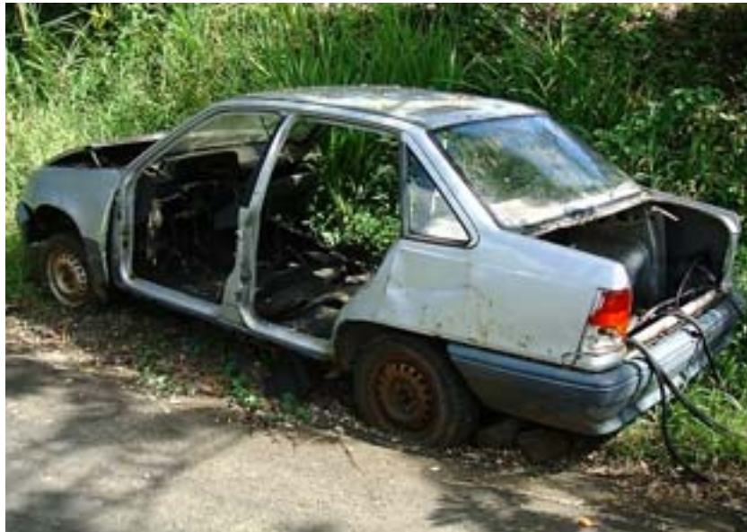
Les carcasses ponctuant les routes attendent d'être recouvertes par la végétation

Les fleurs tropicales constituent pour bon nombre de touristes un élément exotique. Conscients et forts de cette attraction, les jardinières et autres massifs colorés fleurissent de toutes parts sur l'île et à tort et à travers. Ces éléments fleuris sont présents dans toutes les villes de Martinique, ils banalisent le paysage et transposent une vision métropolitaine des infrastructures urbaines.