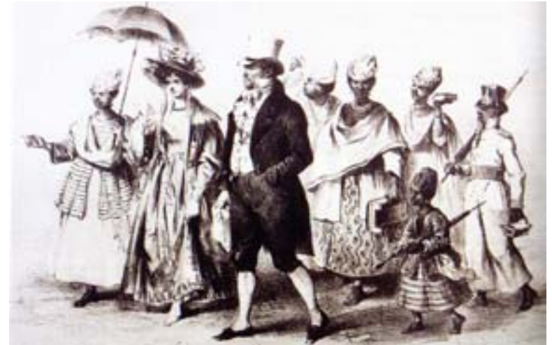
“L'esclavage, signe extérieur de richesse”, extrait de “Le grand livre de l'esclavage, des résistances et de l'abolition”, collection le grand livre