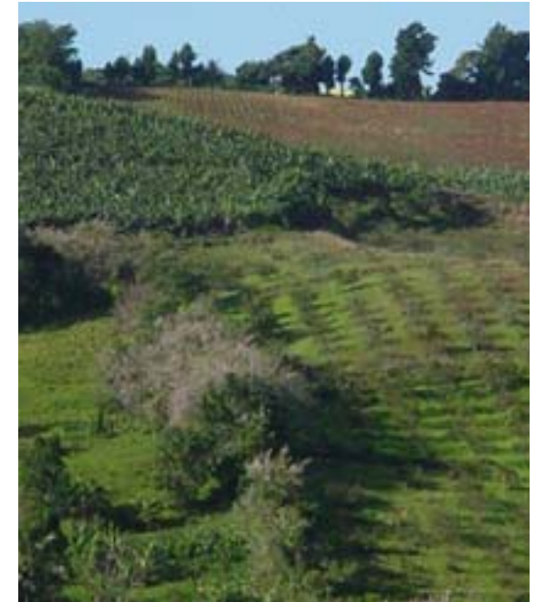
Diversité culturelle des parcelles dans les mornes