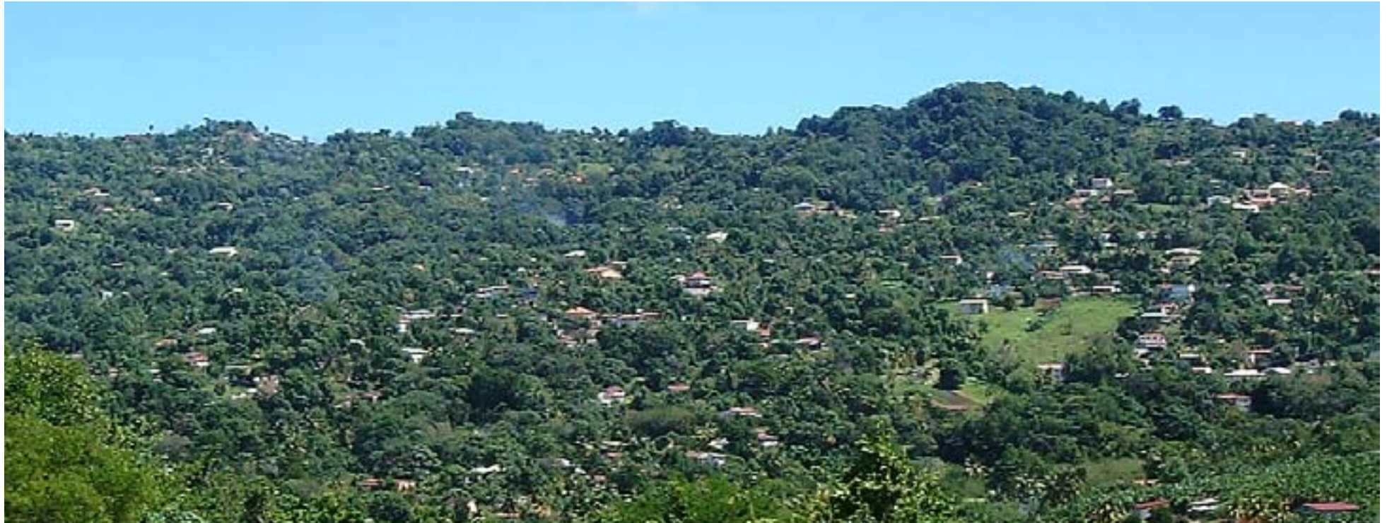
L'implantation des affranchis dans les mornes rompt avec la structure de l'Habitation