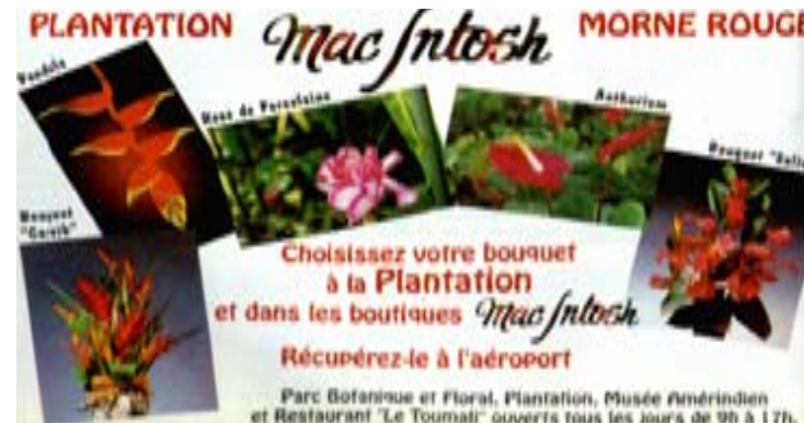
Publicités extraites du “Choubouloute”, le Guide Touristique de la Martinique, décembre 2001/ juin 2002

«...chacune est un petit pays ayant en commun avec sa voisine des plages ombragés de cocotiers et baignées d'eau transparente bleu turquoise. Il fait beau miraculeusement beau mais sans chaleur excessive. Les forêts y sont exubérantes, mais sans bête féroce...» catalogue JET TOURS, Espoirs et déchirements de l'âme créole, collection Autrement, hors série n°41, octobre 1989