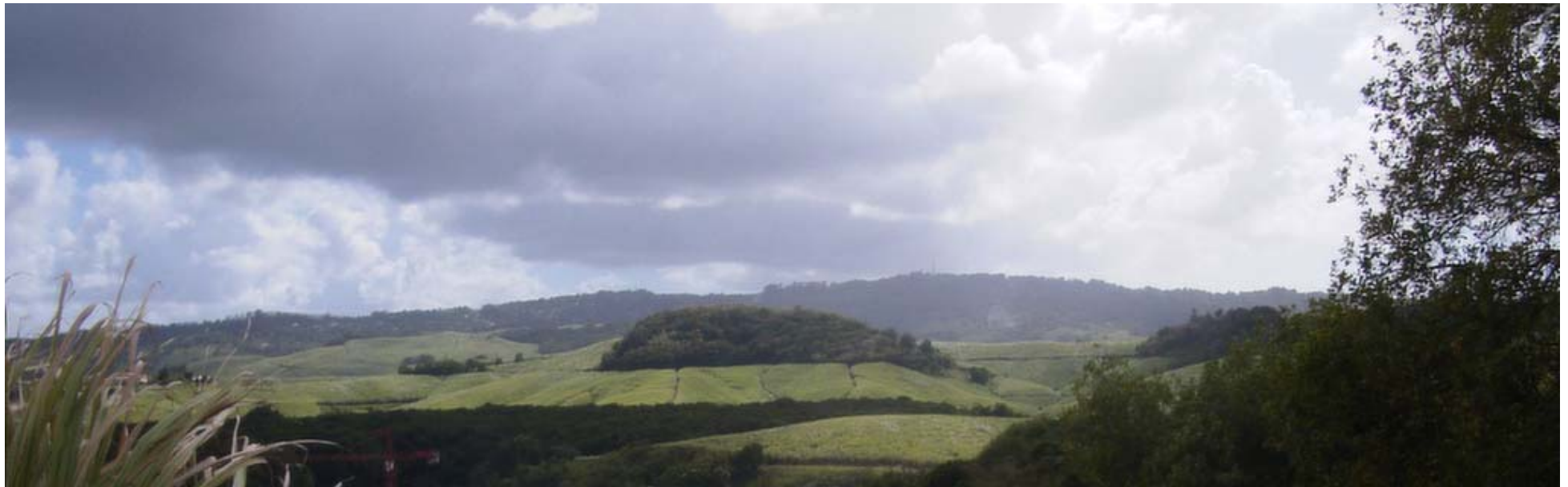
Etendue du paysage de l'Habitation, avec ses grands champs de cannes à sucre

Jusqu'où les insulaires ont-ils intégré leur lourd passé d'esclavage pour promulguer leur identité?