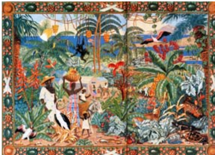
« La savane » de Valdo Barbey extrait de Martinique 1994, Guides Gallimard

« Longtemps considérés d'accès difficile, incultivables, les mornes «facheux» qu'évoque un chroniqueur du XVII ème siècle ne sont pas encore réellement à l'abri de la mauvaise réputation. Il faut dire que, lors des années glorieuses de la colonisation ces bosses qui parsèment un relief accidenté sont déjà le lieu d'élection des esclaves fugitifs . Cela marque les mentalités. D'autant plus que la pièce se rejoue avec quelques variantes à l'abolition de l'esclavage. Les nouveaux libres, oublieux des recommandations des colons, n'ont qu'une idée ; investir les mornes pour marquer la rupture avec les plantations d'en bas.» Extrait de William ROLLE, gens des mornes, gens des villes , Antilles, Espoirs et déchirements de l'âme créole, collection Autrement, hors série n°41, octobre 1989