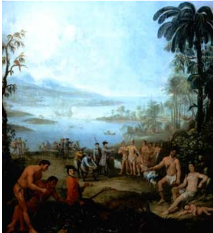
Anonyme, Européens débarquant en Amérique, début du XVII e siècle, extrait de Regards sur les Antilles, collection Marcel Chatillon, Musée d'Aquitaine de Bordeaux, 2000

Propos de Charles Fleury en 1620 en mer Caraïbe