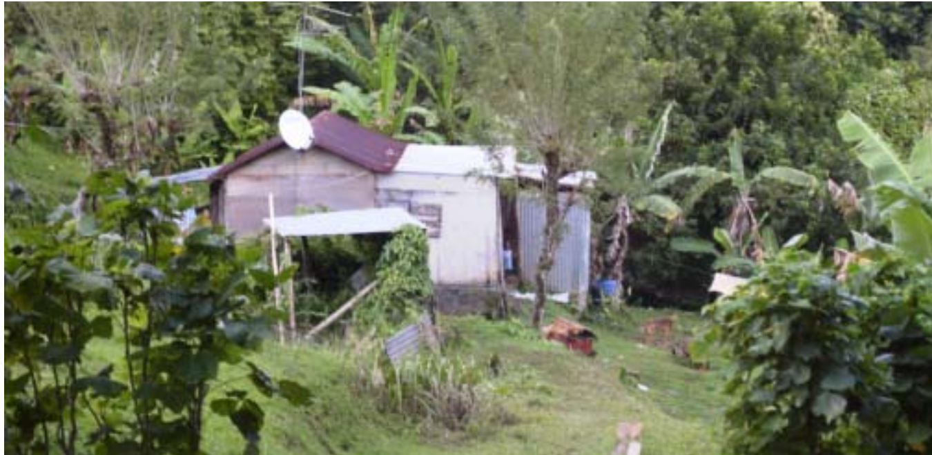
Cases et jardins créoles, une implantation vivrière